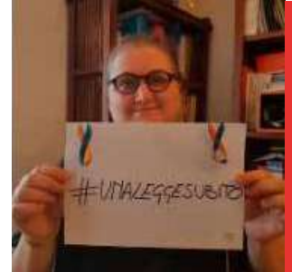
Intervista a Laura Bignami Senatrice della Repubblica, Movimento X

Si tratta di una procedura tecnica necessaria: senza copertura economica e un collegamento nella Legge di Bilancio non era possibile procedere con il testo legislativo. L'istituzione del fondo dà ora il via libera alla definizione di nuovi provvedimenti legislativi che ovviamente sono rimandati alla nuova legislatura. Il comma 255 (la norma che definisce chi è il caregiver familiare) rappresenta una sorta di fondamento per chi vorrà costruirvi sopra l'edificio del corpus normativo dei diritti dei caregiver familiari.